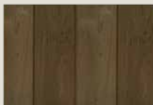
Wärmebehandeltes gebürstetes Roterlenholz